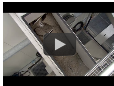
Video: HUBER Coanda Grit Washing Plant RoSF4 https://www.youtube.com/watch?v=nNstEvZA-24