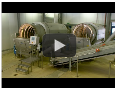
Video: HUBER Coanda Grit Washing Plant RoSF4 in a grit treatment process https://www.youtube.com/watch?v=SpqkL361Sc