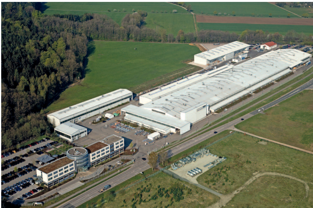
HUBERs huvudkontor och fabrik i Berching, Bayern, Tyskland