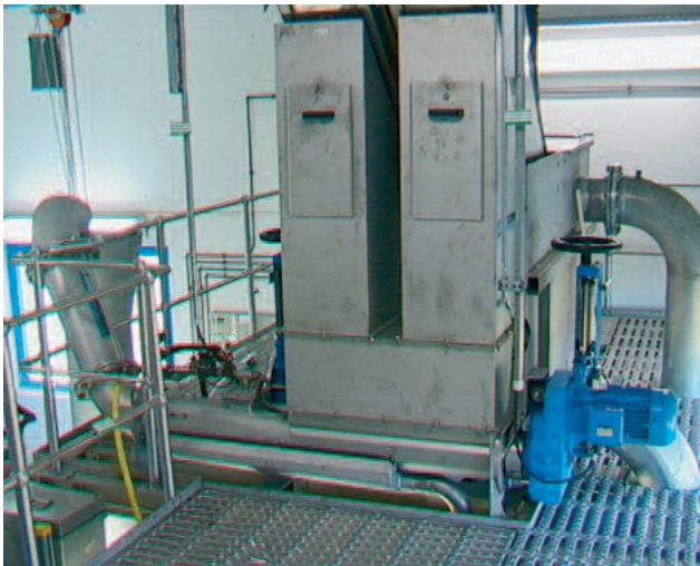
För alla utmatningskrav