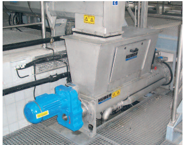
Pålitlig rengodsbearbetning med WAP