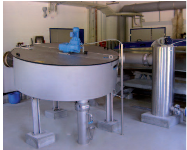
Stationär installation av en ROTAMAT® skivförtjockare RoS 2S storlek 2