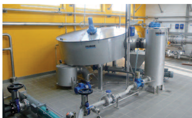
Filterrengöring utan något externt tvättvatten