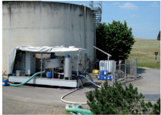
Mobil ROTAMAT® skivförtjockare RoS 2S för minskning av slamvolym för att spara på lagringskapacitet