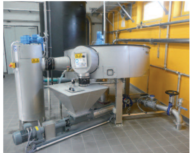
ROTAMAT® skivförtjockare RoS 2S designad för 35 m 3 /h