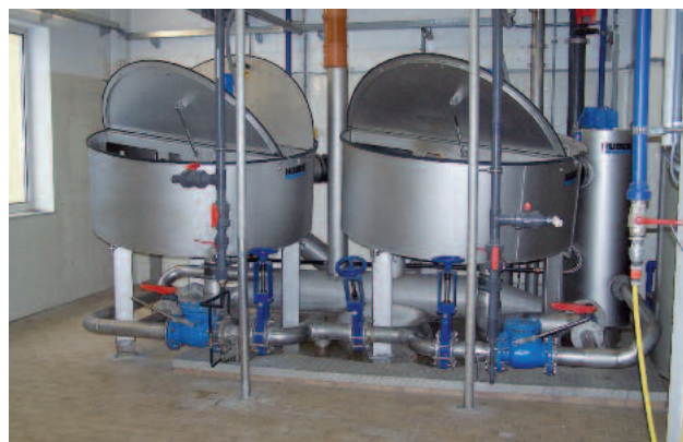
Två enheter installerade på ett begränsat utrymme