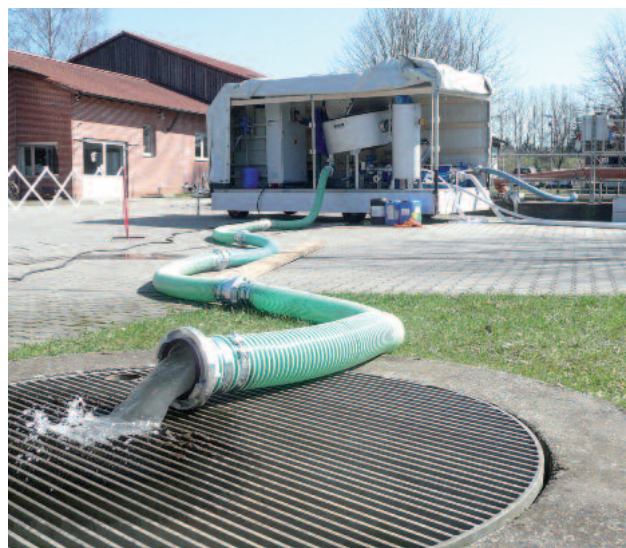
Mobil ROTAMAT® skivförtjockare RoS 2S monterad på en trailer