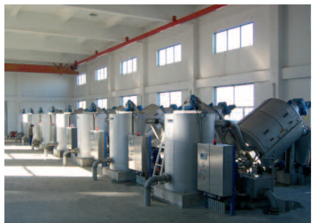
Several units installed in parallel to handle 600 m 3 /h